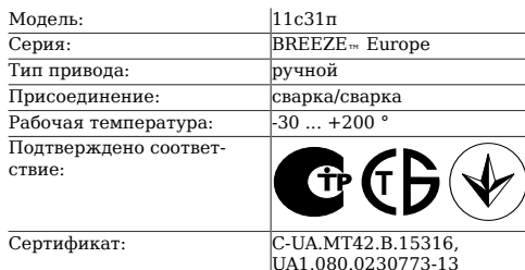
Таблица 1. Характеристики